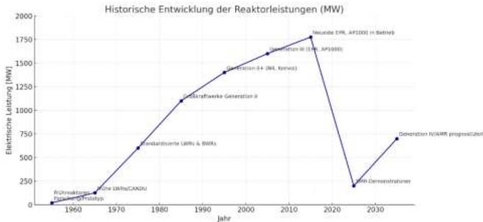
Abbildung 1: ChatGPT Plot (2025)

Schaut man sich die Geschichte der Entwicklung der Leistung der einzelnen Reaktoren an, dann wurden die gebauten Reaktoren eigentlich immer leistungsfähiger.